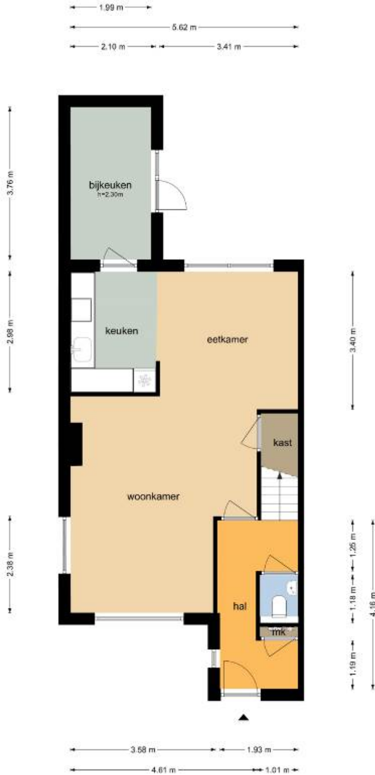
De Lijsterbes 35 - Didam Begane Grond

De plattegronden zijn geproduceerd voor promotionele doeleinden en ter indicatie. Aan de plattegronden kunnen geen rechten worden ontleend.