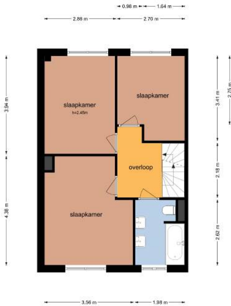
De Lijsterbes 35 - Didam Eerste Verdieping

De plattegronden zijn geproduceerd voor promotionele doeleinden en ter indicatie. Aan de plattegronden kunnen geen rechten worden ontleend.