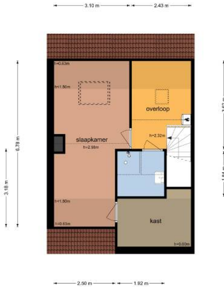
De Lijsterbes 35 - Didam Tweede Verdieping

De plattegronden zijn geproduceerd voor promotionele doeleinden en ter indicatie. Aan de plattegronden kunnen geen rechten worden ontleend © www.objecten.nl